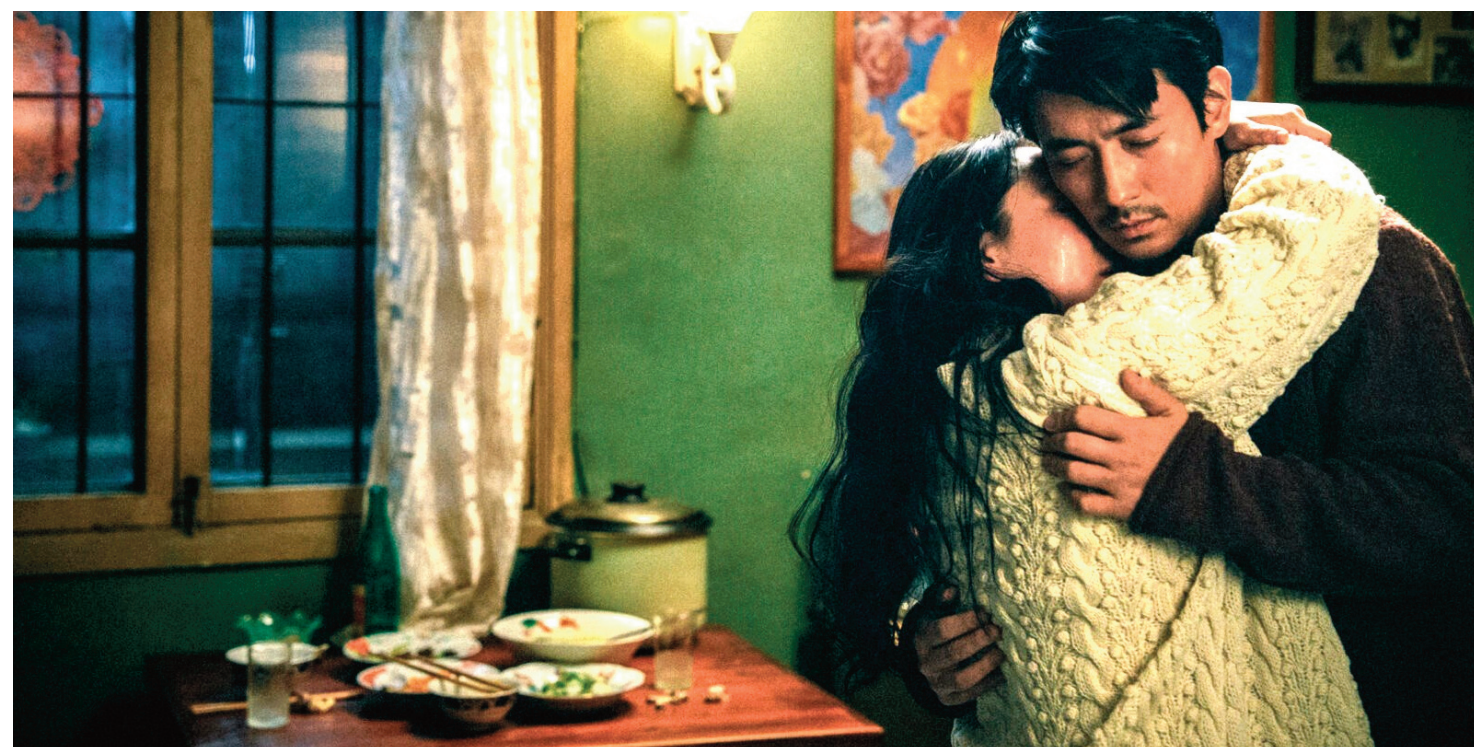
ONLY THE RIVER FLOWS

Cinéma indépendant - Art & Essai - Labellisé Jeune Public — du 3 juillet au 2 septembre 2024